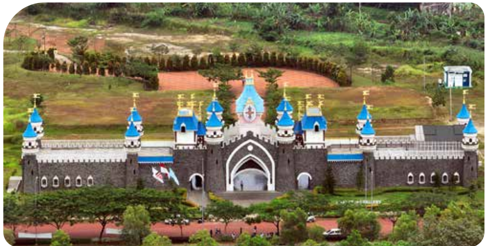
Kawasan Modernland Cilejit