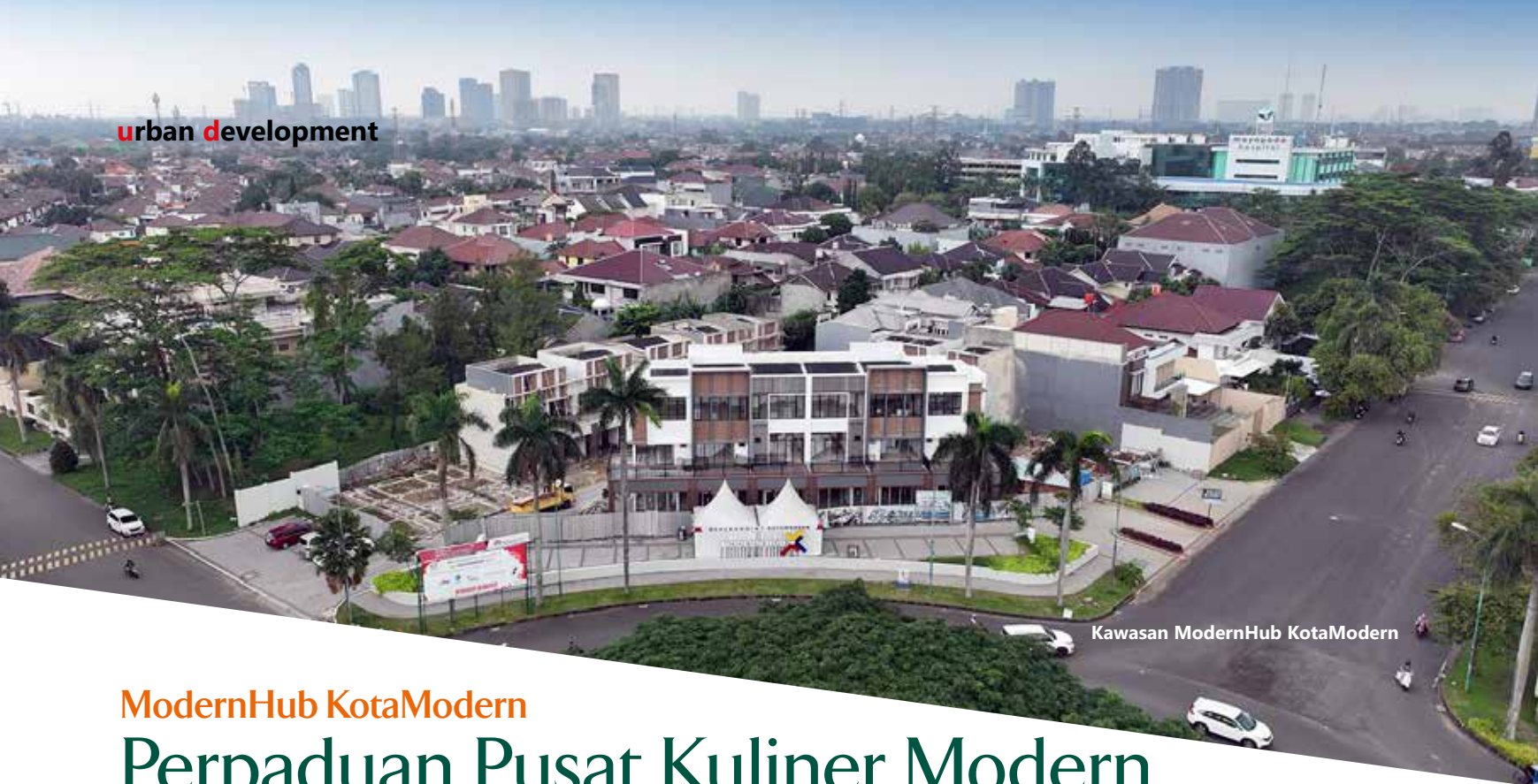
Kawasan ModernHub KotaModern