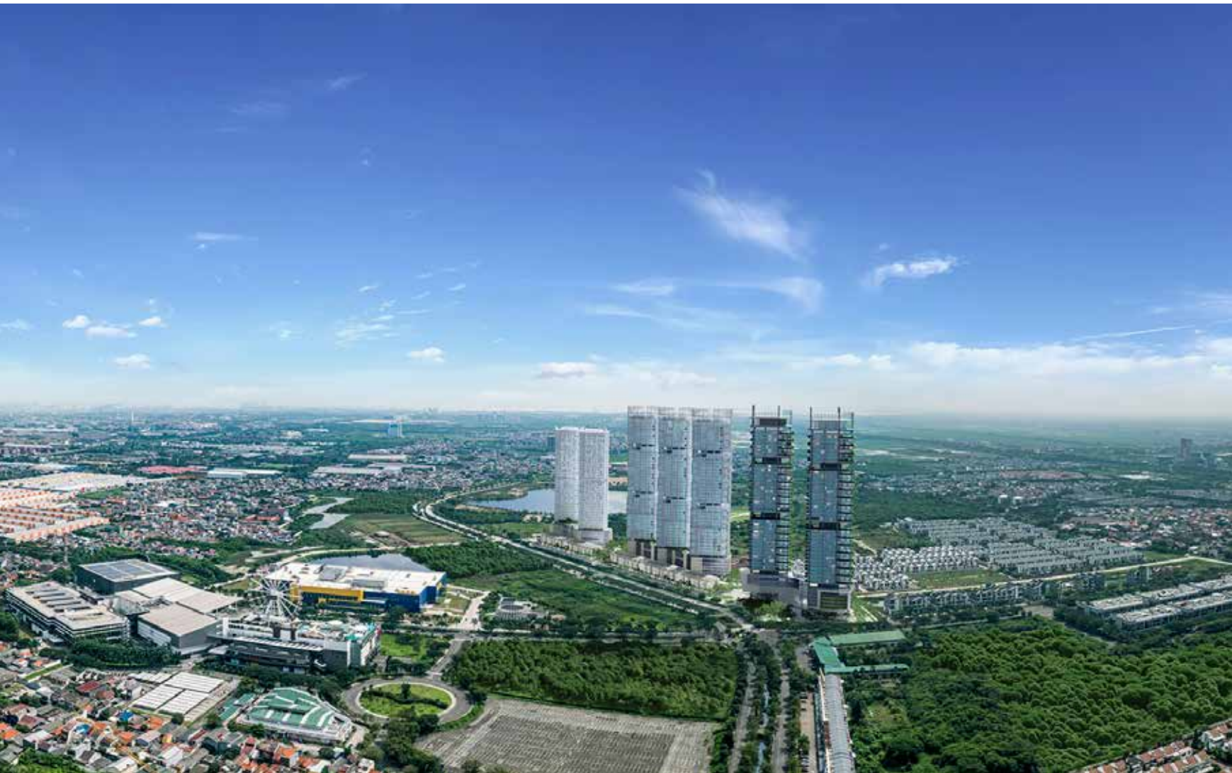
Joint Venture Lotte Land Modern Realty