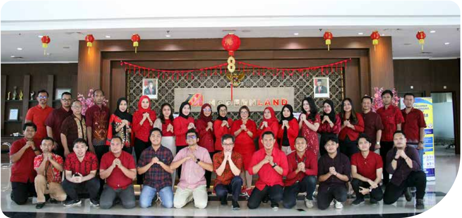
Perayaan Imlek di ModernCikande Industrial Estate