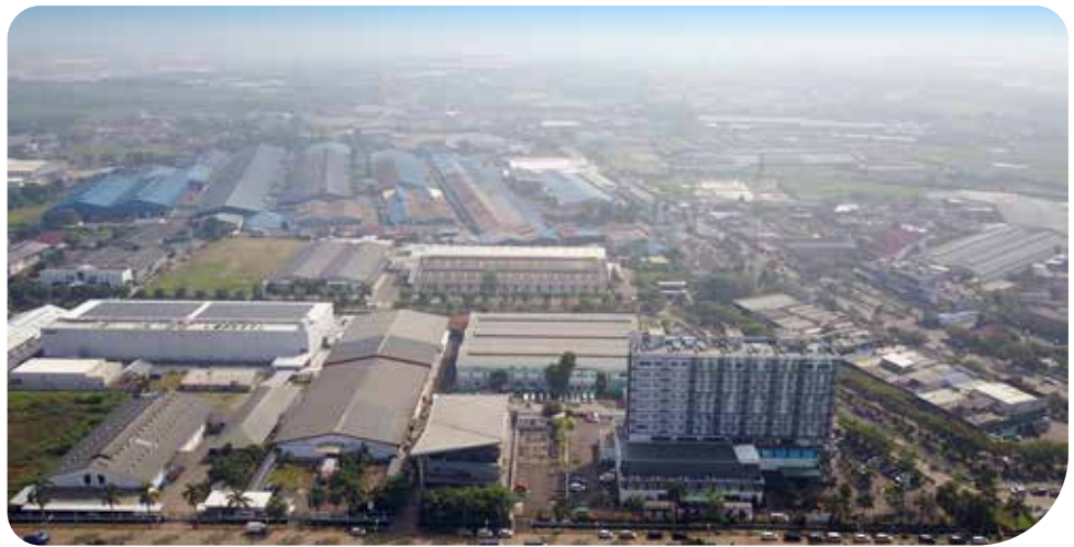
Kawasan ModernCikande Industrial Estate

Sebut saja proyek-proyek utama seperti township Jakarta Garden City di Jakarta Timur, KotaModern dan ModernlandCilejit di Tangerang serta kawasan industri ModernCikande Industrial Estate (MCIE) di Serang, Banten masih menjadi motor utama penggerak marketing sales Perseroan untuk beberapa tahun ke depan. Mengingat cadangan lahan yang dapat dikembangkan masih sangat potensial.