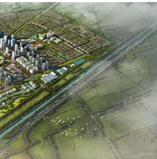
Joint Venture Waskita Modern Realty

mengembangkan proyek mixed use di kawasan township Jakarta Garden City. Akan dikembangkan kawasan multifungsi seluas 5 hektar yang menawarkan diferensiasi berupa sistem koridor ganda