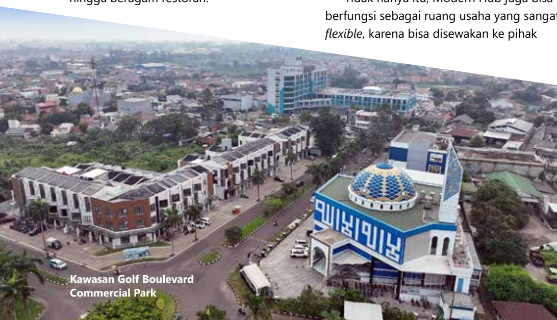
Kawasan Golf Boulevard Commercial Park

Sebelumnya, KotaModern juga telah melakukan serah terima unit-unit Ruko Golf Boulevard Commercial Park kepada pembelinya. Ruko Golf Boulevard Commercial Park yang mengusung desain modern tropis dibangun dalam jumlah terbatas, yakni hanya 40 unit saja di atas lahan seluas 6000 m 2 . Ruko 2 lantai berdimensi Luas Bangunan (LB) 112 m 2 dan Luas Tanah (LT) 80 m 2 dipasarkan mulai dari Rp2 miliar-an. Saat ini, Ruko Golf Boulevard Commercial Park sudah terjual lebih dari 80 persen. Beberapa ruko bahkan telah ada yang ditempati oleh penghuni maupun penyewa untuk menjalankan usaha yang beragam. –modernliving–