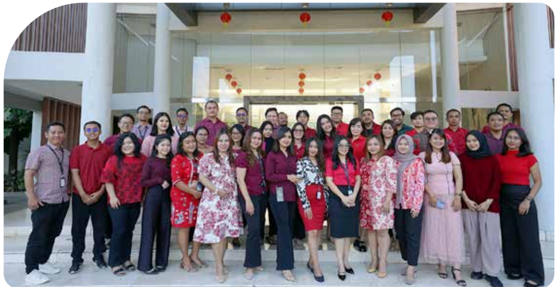
Perayaan Imlek di Jakarta Garden City

ungkapan rasa syukur atas pencapaian yang diperoleh Perseroan selama ini. "Karena itu perayaan Imlek kali ini harus bisa memacu semangat kebersamaan kita untuk meningkatkan kinerja lebih