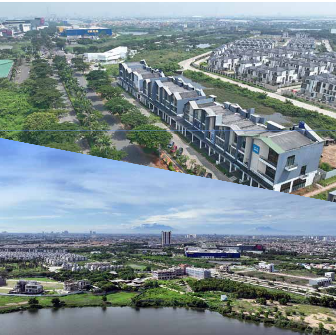
Kawasan Jakarta Garden City