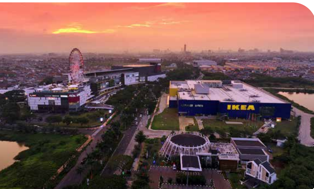
Jakarta Garden City

Sebagai sebuah kawasan perumahan skala kota, Modernland Cilejit pertama kali dikembangkan pada tahun 2019. Memiliki rencana pengembangan total hingga seluas 1.000 hektar, saat ini sudah terdevelop 120 hektar. Modernland Cilejit dirancang sebagai kota masa depan premium dan resort living yang akan dilengkapi oleh berbagai fasilitas terbaik seperti sarana pendidikan, Theme Park , Water Park dan Edu Park , sarana kesehatan, area komersial, sales gallery tematik, sarana transportasi