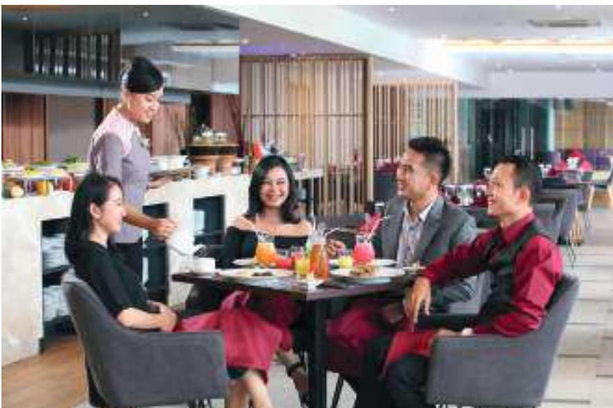
Restoran di hotel Swiss-Belinn ModernCikande.