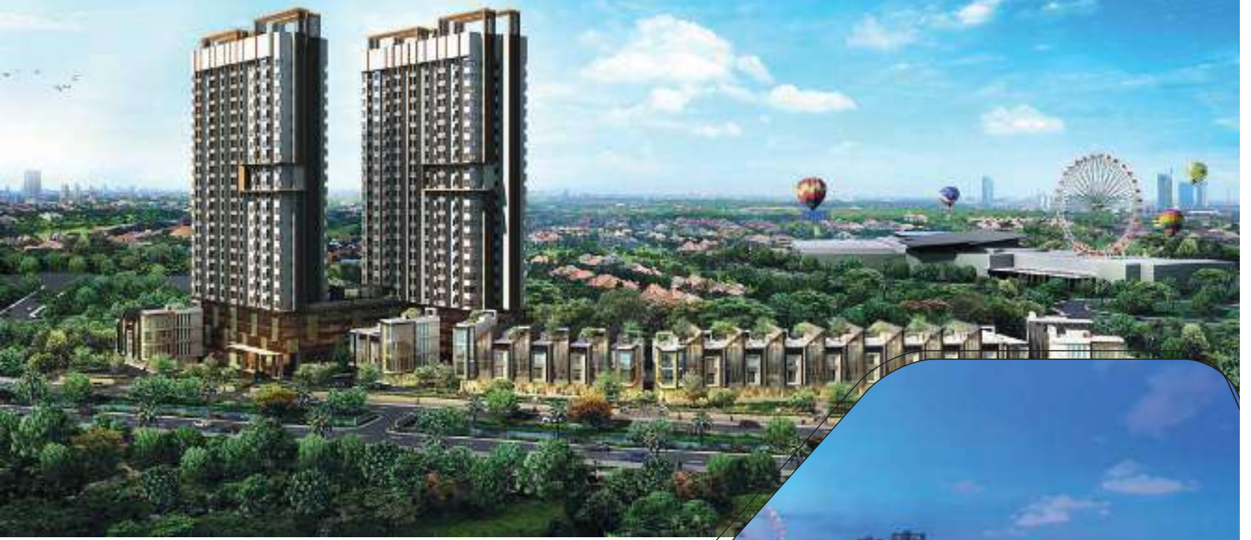
Cleon Park Apartment

dengan ukuran unit terkecil mulai dari 32 m2 (semi gross) dan terbesar 73 m2 (semi gross).