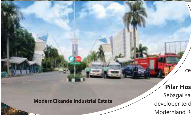
ModernCikande Industrial Estate

dikembangkan mencapai 40% dengan sisa landbank sekitar 1900-an hektar. Saat ini ModernCikande telah dihuni lebih dari 200 perusahaan baik lokal maupun internasional dengan berbagai ragam jenis usaha. Perusahaan yang mendominasi adalah perusahaan chemical , diikuti oleh perusahaan yang bergerak di bidang otomotif, steel, metal product & smelter serta perusahaan di bidang home & building materials .