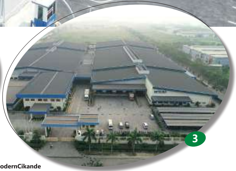
1-2-3 Kawasan ModernCikande

beberapa tahun belakangan dan ModernCikande telah membuktikan janjinya. Kegiatan operasional kami berjalan baik tanpa adanya gangguan dari orang-orang yang tidak bertanggung jawab yang kerap terjadi di kawasan industri lainnya. Saya merekomendasikan sepenuhnya kawasan industri ModernCikande sebagai tuan rumah bisnis