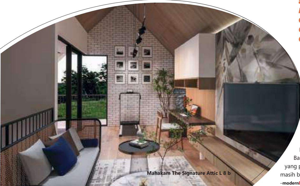
Mahakam The Signature Attic L 8 b