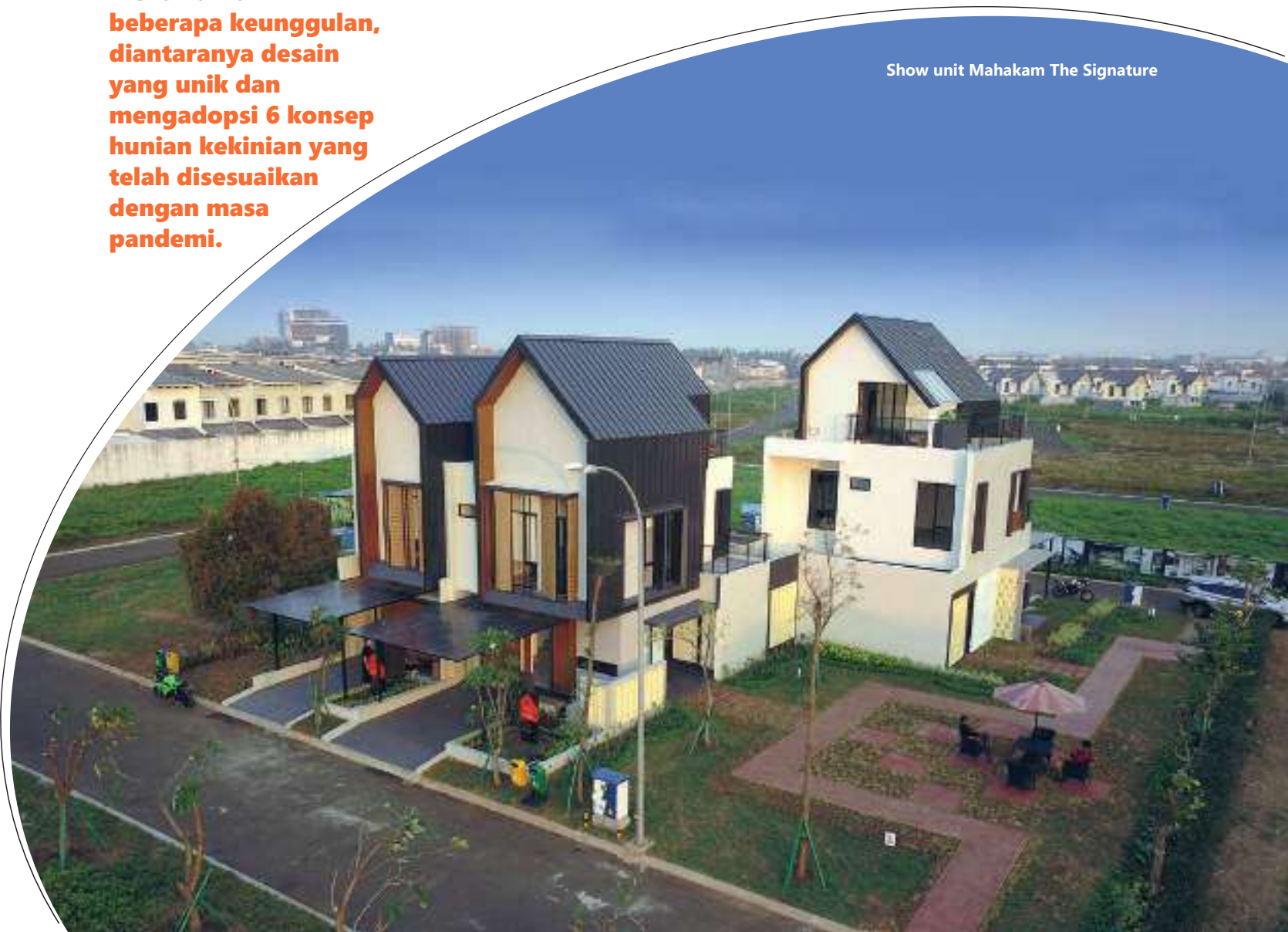
Show unit Mahakam The Signature

Mahakam The Signature menawarkan beberapa keunggulan, diantaranya desain yang unik dan mengadopsi 6 konsep hunian kekinian yang telah disesuaikan dengan masa pandemi.