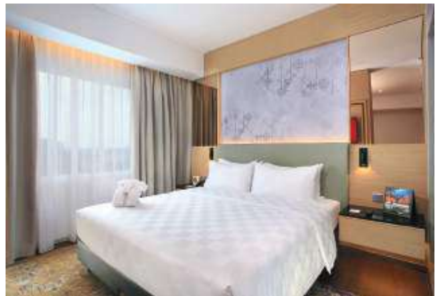
Ruang kamar hotel Swiss-Belinn ModernCikande.

Menyusul MGCC, portofolio Modernland Realty dalam pilar Hospitality berikutnya adalah Novotel Hotel Gajah Mada. Mulai beroperasi pada Desember 2012, hotel yang memiliki 235 kamar ini terletak di dalam kawasan superblock Green Central City (GCC) yaitu superblok yang berada di jantung daerah komersial paling aktif di Jakarta. Hotel ini menawarkan tiga tipe kamar, yaitu Superior, Premier, dan Suite. Sebagai hotel bintang empat, Novotel Gajah Mada juga memiliki kelengkapan fasilitas untuk memanjakan para tamunya, mulai dari area lobi, di mana