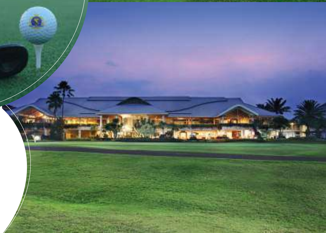
Modern Golf & Country Club dengan berbagai fasilitasnya.

“ Modernland Realty yakin, jika perusahaan yang memiliki porsi recurring income akan cenderung lebih stabil dibandingkan yang tidak memiliki pendapatan berulang. ”