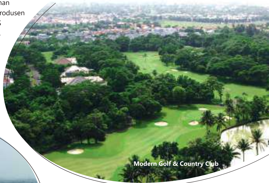
Modern Golf & Country Club

Hotel Novotel Gajah Mada berlokasi di kawasan Green Central City (GCC) Jakarta Pusat. Selain menyediakan okupansi 235 kamar, hotel bintang 4 ini juga dilengkapi dengan ruang rapat dan ruang serbaguna yang dapat digunakan untuk menyelenggarakan berbagai acara perusahaan dan sosial.