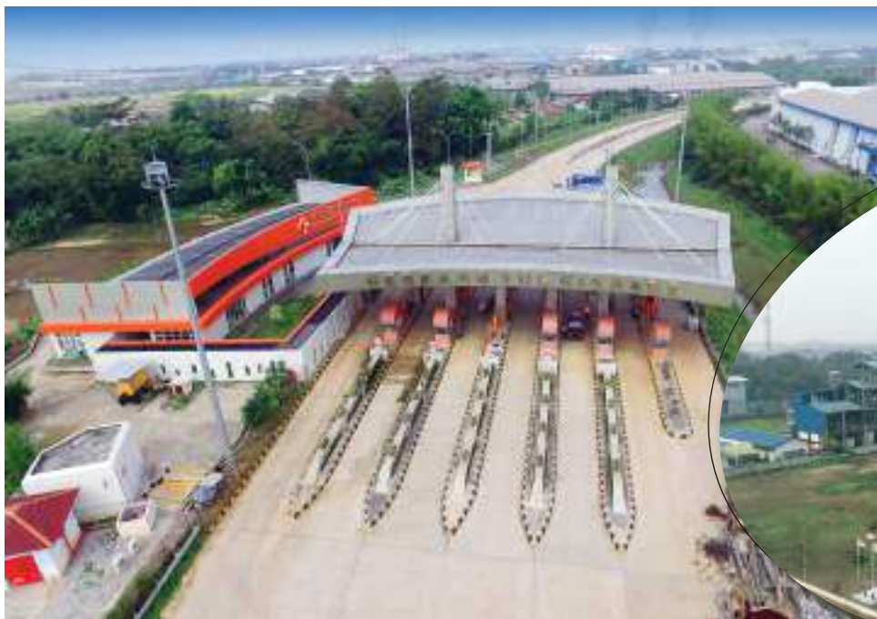
Gerbang Tol Cikande

Dari beberapa kawasan industri yang ada di Kabupaten Serang, Kawasan industri ModernCikande merupakan salah satu kawasan industri terbesar di barat Jakarta. ModernCikande dikembangkan PT Modern Industrial Estat, yang merupakan anak usaha PT Modernland Realty Tbk. Lokasinya pun terbilang strategis yakni berada di kawasan Cikande, Serang, Banten, atau sekitar 68 km dari Jakarta, 75 km dari Pelabuhan Tanjung Priok dan 50 km dari Bandara Internasional Soekarno-Hatta. ModernCikande dapat diakses melalui tol Jakarta-Merak kemudian keluar melalui pintu tol Cikande yang hanya berjarak 900 meter dari pintu gerbang utama kawasan ModernCikande.