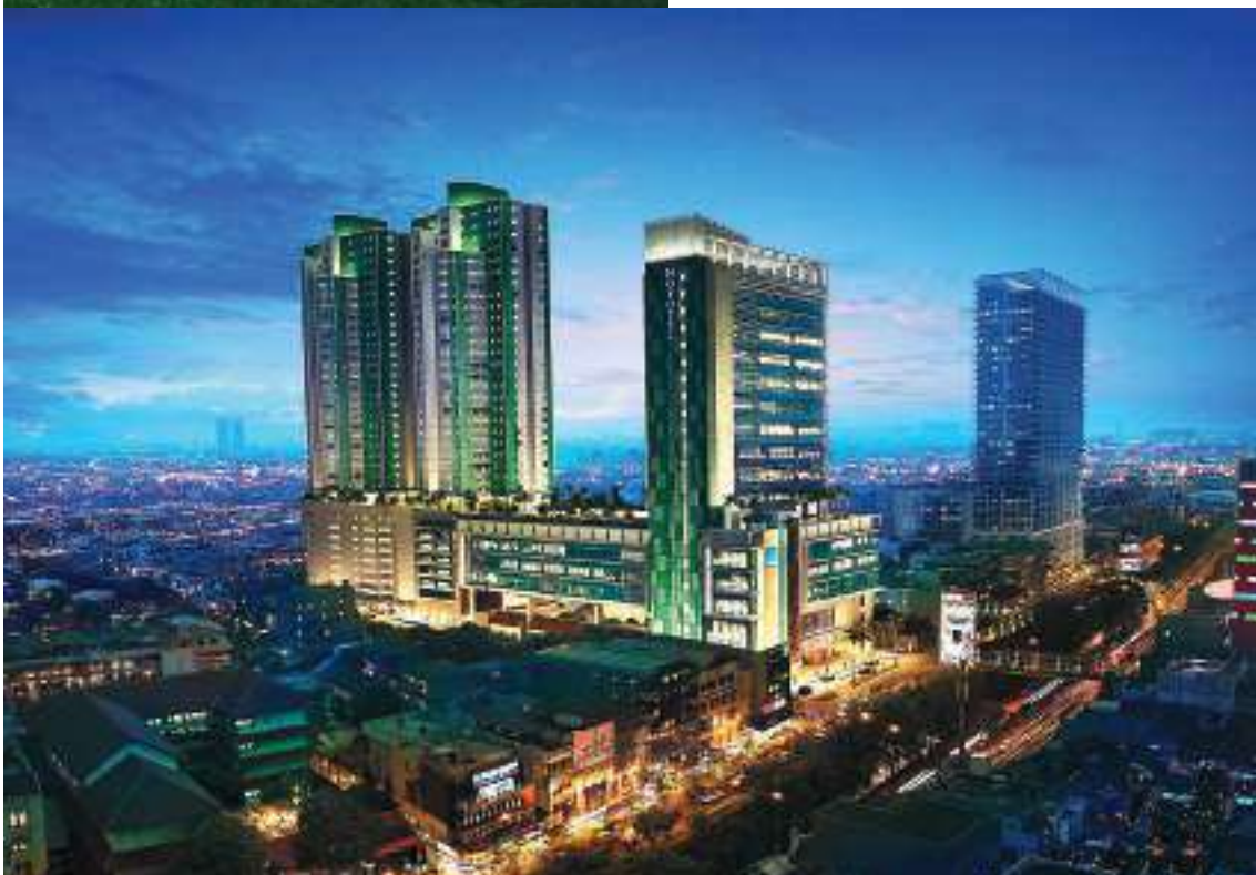
Hotel Novotel Gajah Mada.

Selain lapangan golf, MGCC juga dilengkapi Club House yang memiliki fasilitas lapangan berbagai cabang olah raga, meliputi lapangan tenis, bulutangkis, squash, kolam renang, futsal, indoor soccer serta dilengkapi pula dengan tempat menginap berbentuk bungalow. MGCC juga dilengkapi dengan ballroom yang dapat digunakan untuk berbagai acara gathering dan meeting dengan kapasitas 1.000 orang.