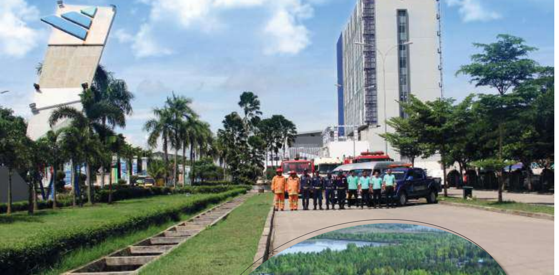
Siap siaga di kawasan ModernCikande

“PT Modern Industrial Estat saat ini tengah berusaha meningkatkan kualitas melalui Sistem Manajemen Mutu ISO 9001:2015 dan Sistem Manajemen Lingkungan ISO 14001:2015.