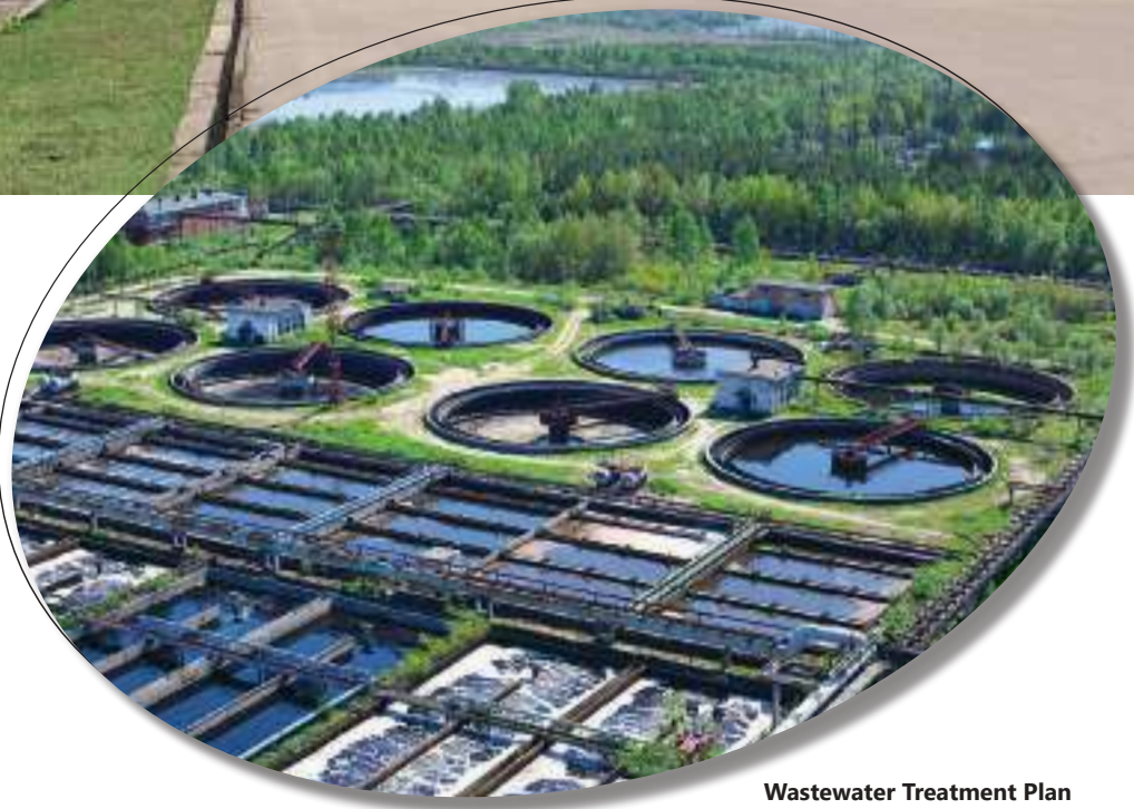
Wastewater Treatment Plan ModernCikande

“PT Modern Industrial Estat saat ini tengah berusaha meningkatkan kualitas melalui Sistem Manajemen Mutu ISO 9001:2015 dan Sistem Manajemen Lingkungan ISO 14001:2015.