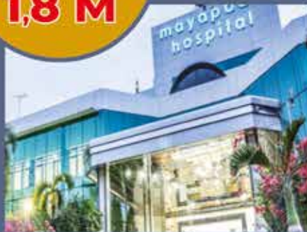
Rumah Sakit Mayapada

LOKASI STRATEGIS MAIN ENTRANCE UTARA KOTA MODERN