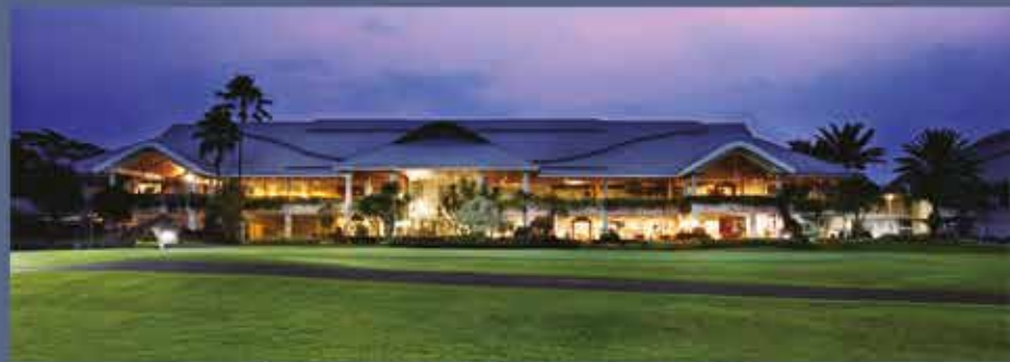
Modern Golf & Country Club