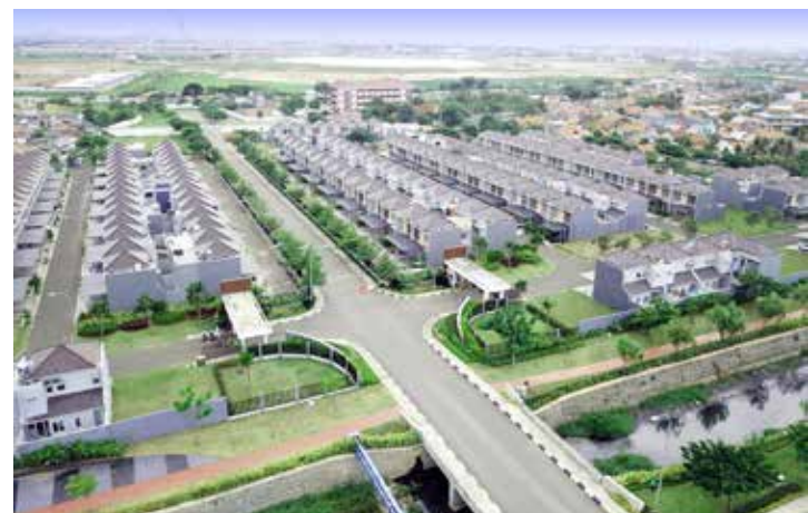
Perumahan Jakarta Garden City