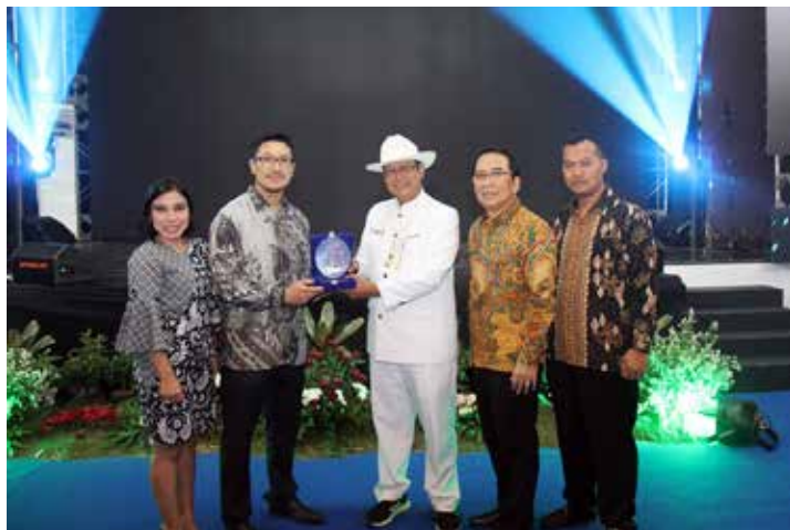
MoU Modernland Cilejit & PT KAI (Persero)