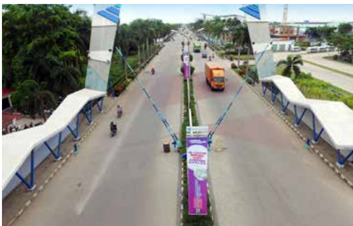
Gerbang ModernCikande Industrial Estate