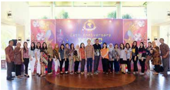
Peringatan Hari Batik Nasional MGCC