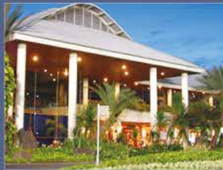
Modern Golf & Country Club