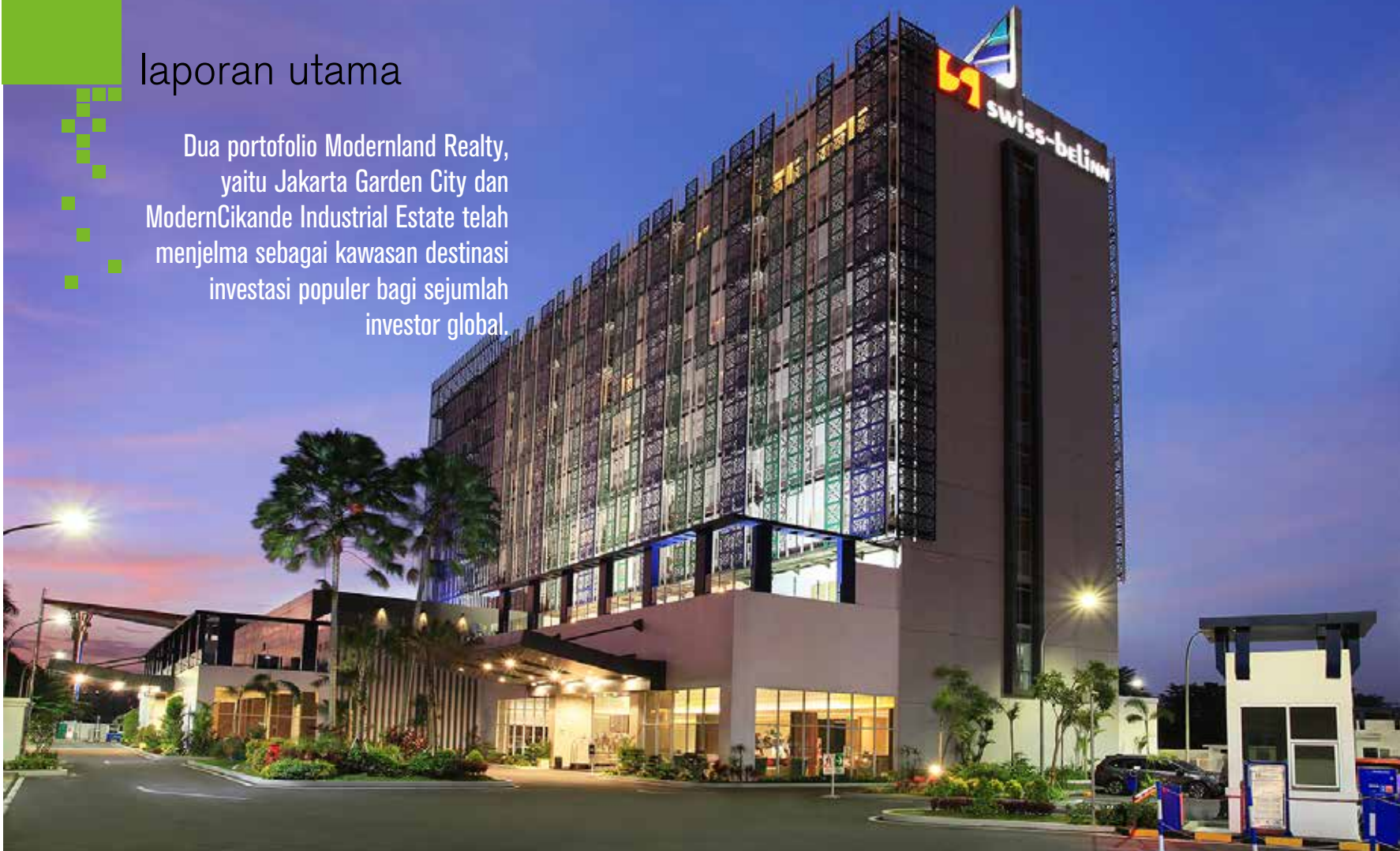
Swiss-Belinn Cikande Banten

Dua portofolio Modernland Realty, yaitu Jakarta Garden City dan ModernCikande Industrial Estate telah menjelma sebagai kawasan destinasi investasi populer bagi sejumlah investor global.