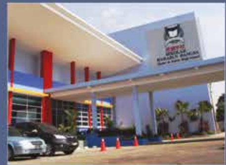
Sekolah Harapan Bangsa