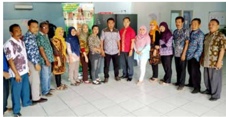
Peringatan Hari Batik Nasional Low Cost Housing