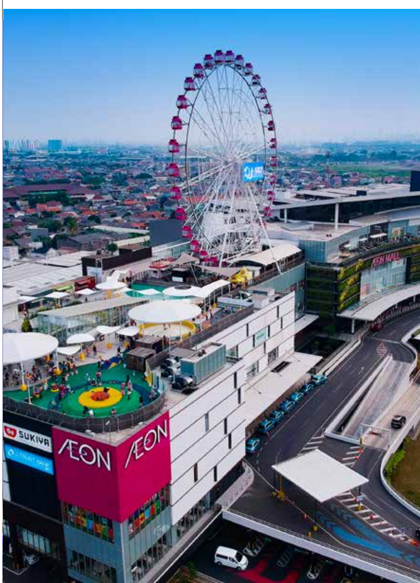
AEON Mall Jakarta Garden City

Hongkong Land, Astra International dan Modernland melalui Astra Modern Land membangun kawasan perumahan bertajuk Asya seluas 70 hektar dengan standar internasional. Proyek Asya akan merangkum proyek perumahan, apartemen, lake villas , area komersial, dan area ruang terbuka publik dengan total gross floor area lebih dari 1 juta m 2 .