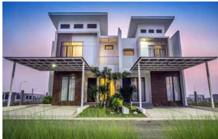
Tipe Perumahan Jakarta Garden City