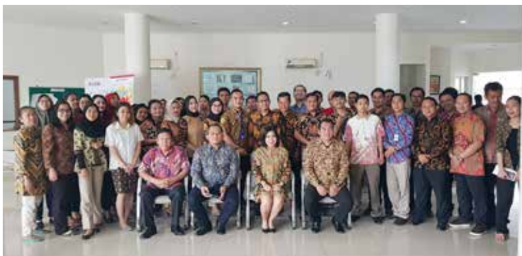
Peringatan Hari Batik Nasional Kota Modern

SEPERTI TAHUN-TAHUN sebelumnya, memperingati Hari Batik Nasional yang ditetapkan setiap tanggal 2 Oktober, seluruh jajaran direksi dan karyawan dalam lingkup PT Modernland Realty Tbk. beserta entitas bisnisnya , serentak mengenakan pakaian batik di lingkungan kerja masing-masing unit usaha.