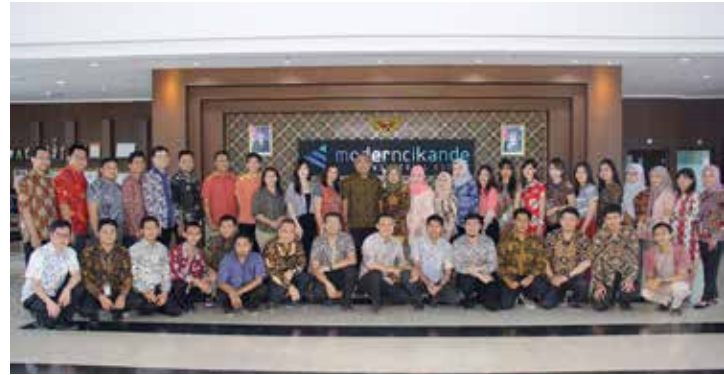
Peringatan Hari Batik Nasional MIE