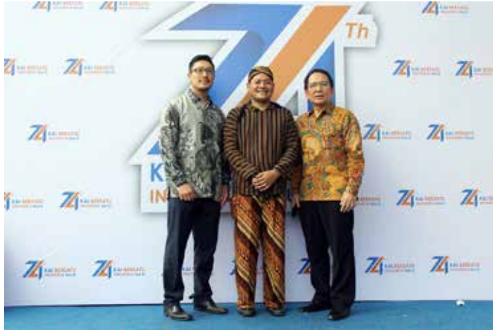
MoU Modernland Cilejit & PT KAI (Persero)