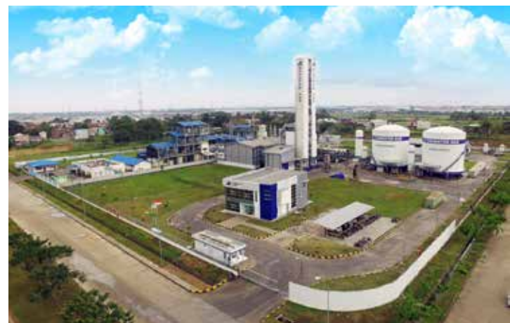
Tenant di ModernCikande Industrial Estate