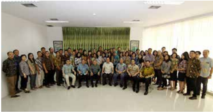
Peringatan Hari Batik Nasional Holding Modernland