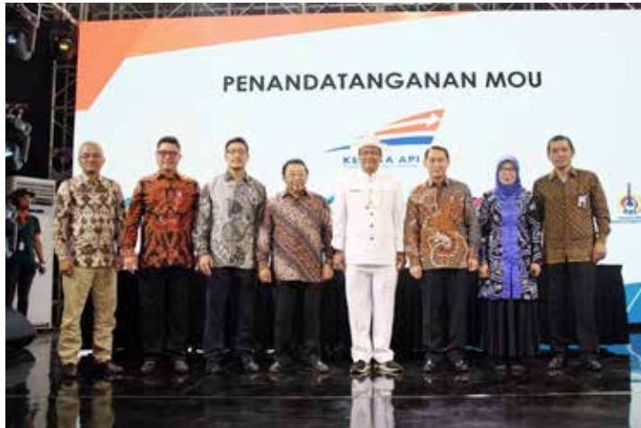
MoU Modernland Cilejit & PT KAI (Persero)