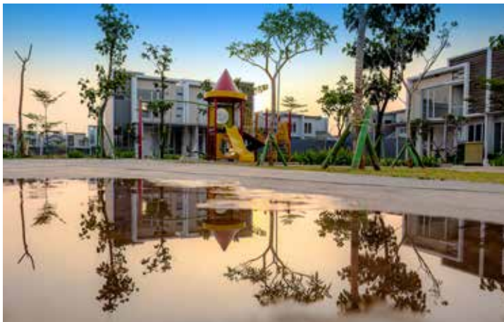
Suasana Perumahan Jakarta Garden City