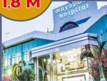
Rumah Sakit Mayapada

LOKASI STRATEGIS MAIN ENTRANCE UTARA KOTA MODERN